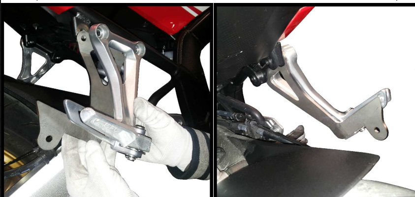
Fissaggio staffa 50.SS.873.1 Fitting bracket 50.SS.873.1