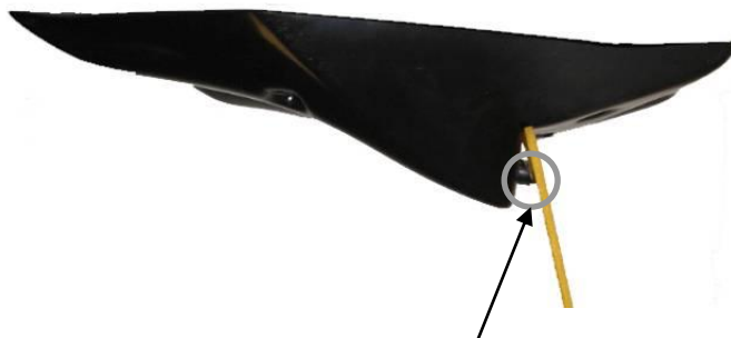
Position des entretoises biseautées