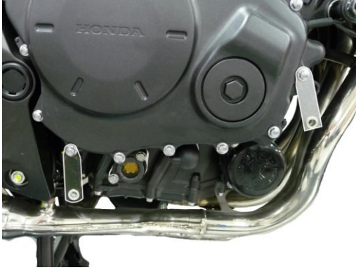
Fitting brackets on the right