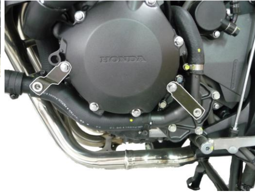
Fitting brackets on the left