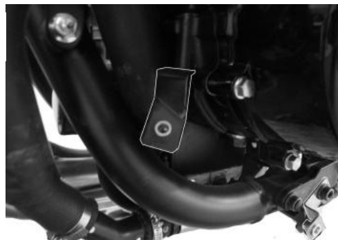
Pattes de fixation côté droit