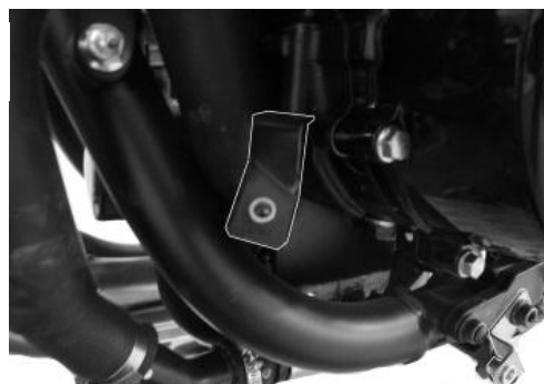
Right-hand side fitting bracket