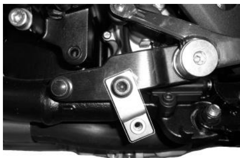
Left-hand side fitting bracket