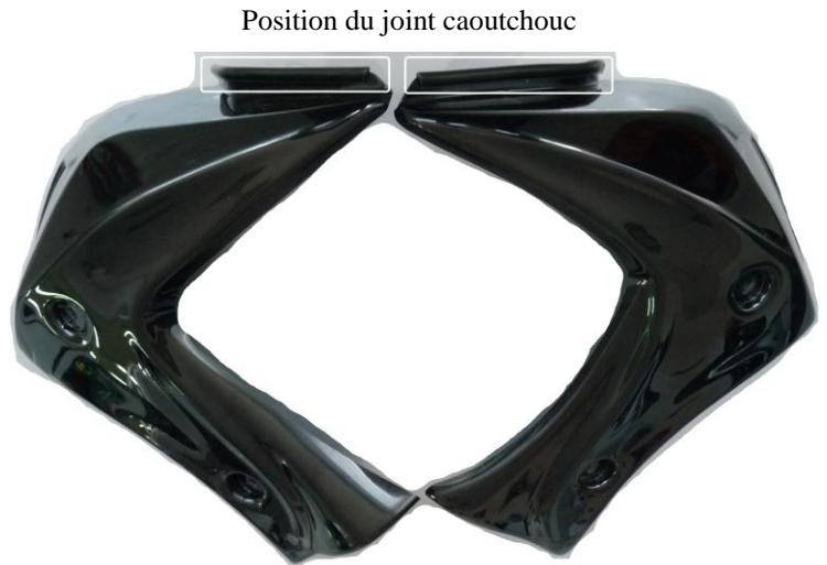
Position du joint caoutchouc