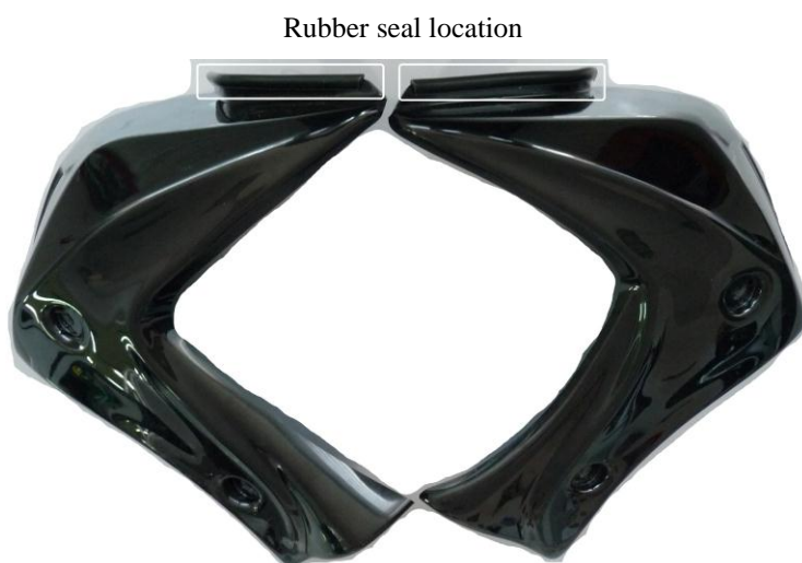
Rubber seal location