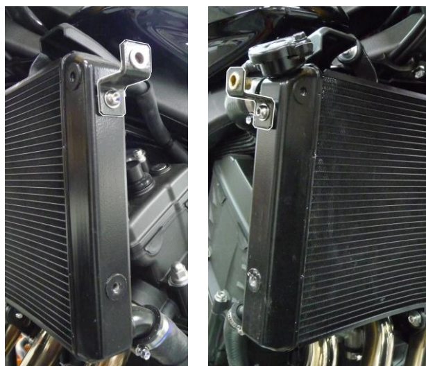
Fitting brackets location