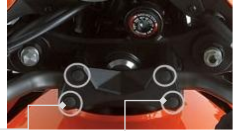
Photo 2 Screws to remove and replace