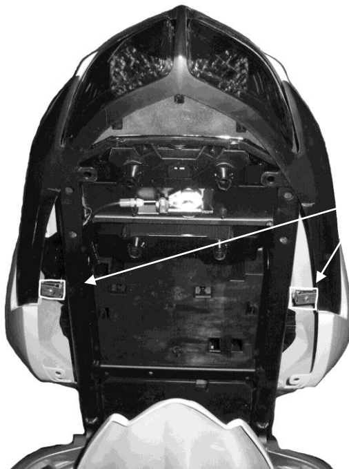
Position des agrafes filetées

Pneu d'origine : Dunlop D221 190/50 ZR17