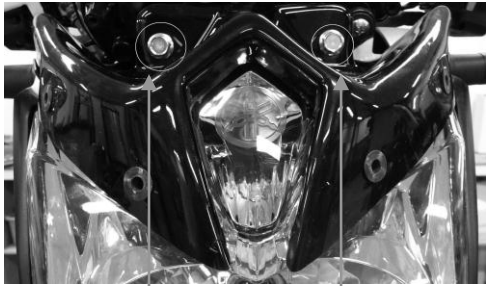
Keeping screw of the taillight and the screen holder