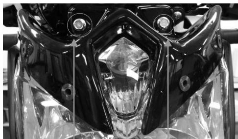
Vis de maintien du phare et du support bulle