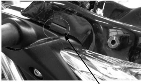
Position of pieces of rubber seal