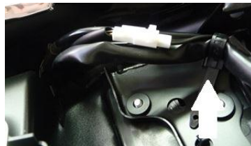
Clips et emplacement des cosse