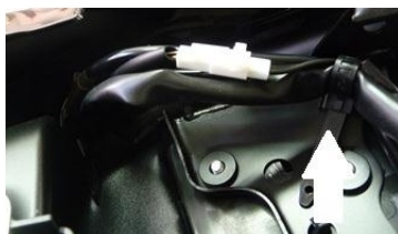
Terminals' clips and location