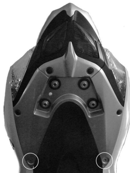
Position des agrafes filetées