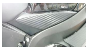
Cache latéral gauche