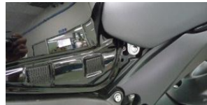
L+R panels' fixation view