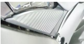
Right side panel