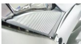
Cache latéral droit

- Enlever la selle passager. Démontez la selle conducteur : pour cela, démonter les 2 caches latéraux de manière à avoir accès aux 2 vis cruciformes de fixation de la selle. Les caches latéraux sont clipsés et scratchés. Dévisser les 2 vis cruciformes de fixation de la selle conducteur.