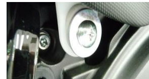
L+R seat fitting screws