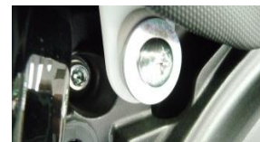
Vis fixation selle G+D

- Une fois la selle conducteur enlevée, dévisser la vis cruciforme de fixation de la demi-coque arrière (photo 1) et enlever les 2 clips du dessus (photo 2), puis les 2 clips du dessous (photo 3).