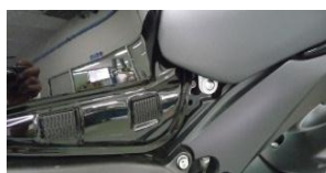
Vue fixation caches G+D