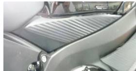
left side panel