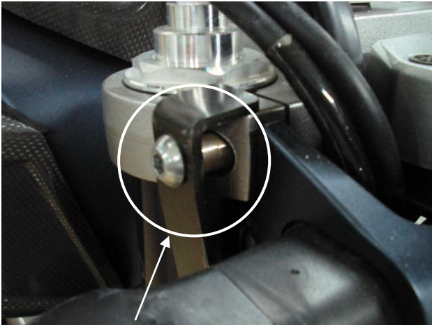
Position des entretoises et patte de fixation