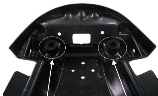
Position des entretoises Ø10 L : 5mm + L : 10mm